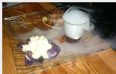
PREMIO TAPA MAIS CREATIVA DA V EDICIÓN